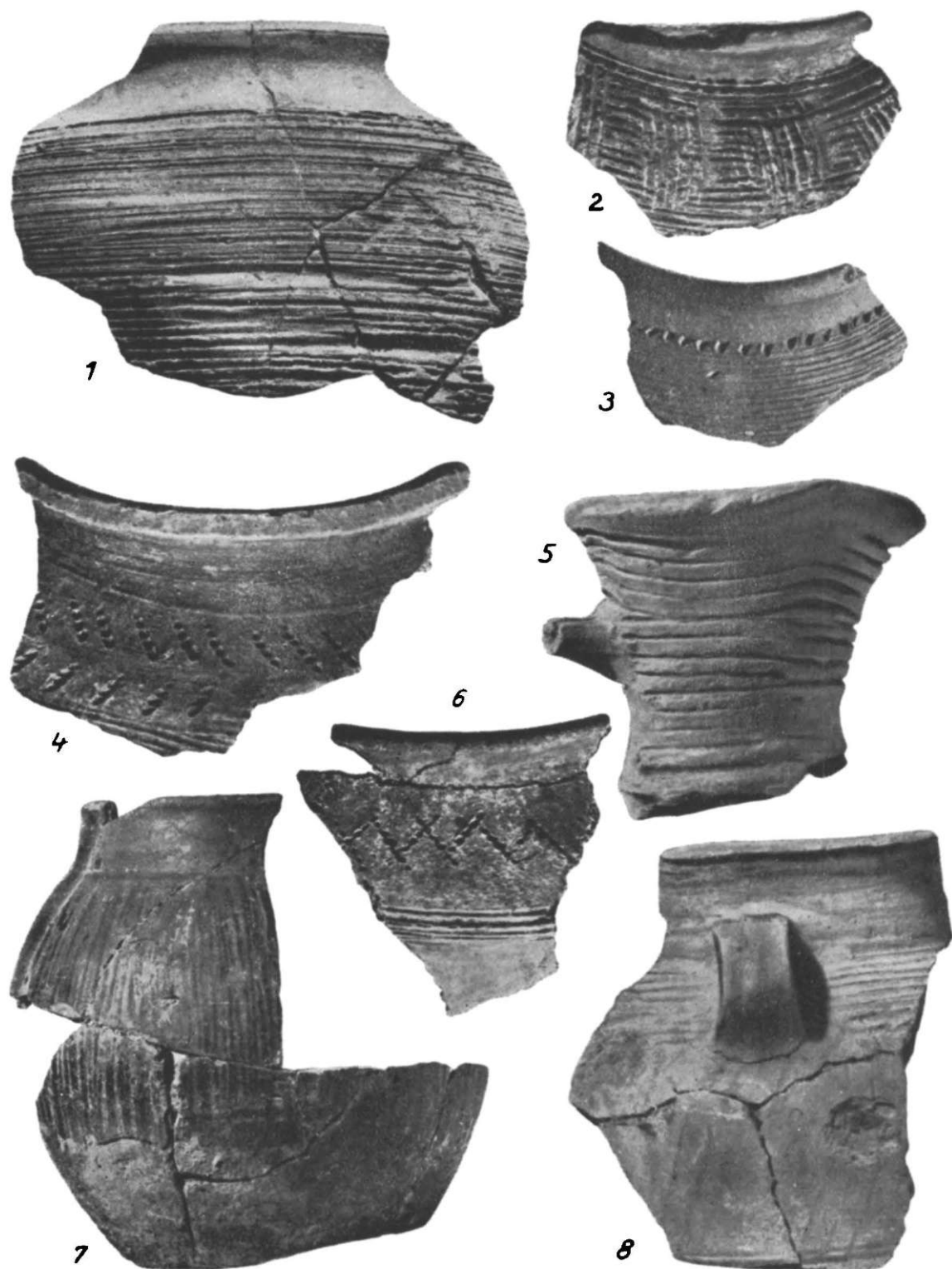
Fig. 1. Dridu. Fragmente ceramice din bordeiele a și d.